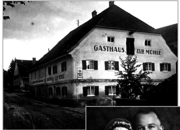
Der Gasthof um 1940