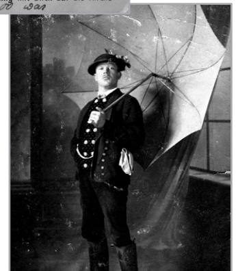
Anton Seidl im Bauern- theater um 1920